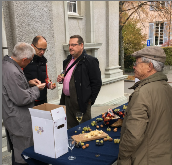
Die Zünfter und der Quartierverein vor der reformierten Kirche Fluntern