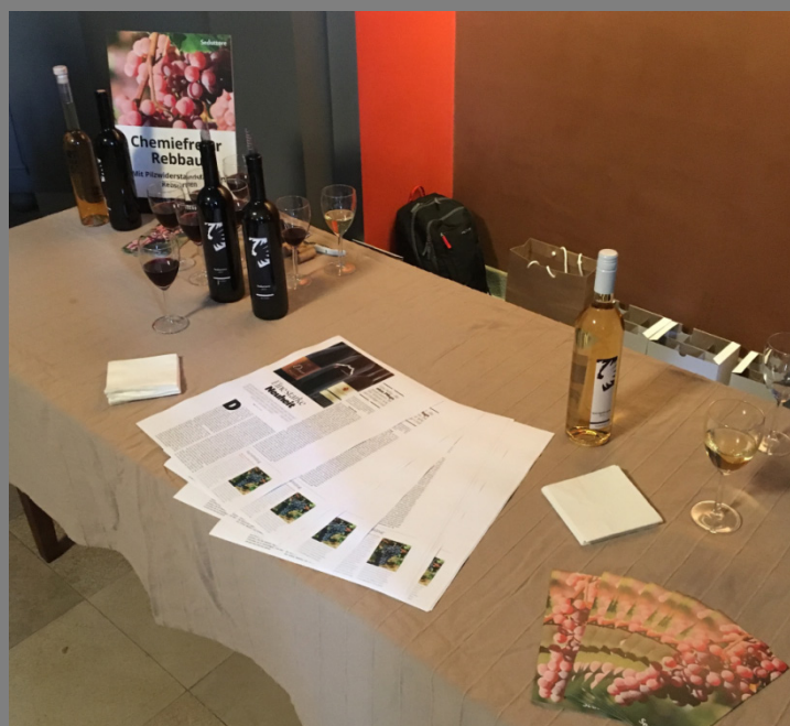
Haben nichts mit Bioweinen zu tun: die chemiefreien Seduttore Rosso Barrique und der Sauvignier Gris