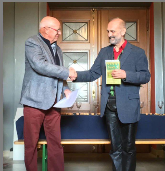
Handschlag von Quartier zu Quartier über den See hinweg