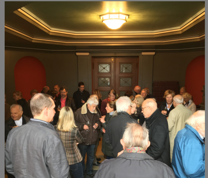
Viele Interessierte aus Fluntern strömen zu Speis und Trank ins prächtige polychorme Kirchenfoyer