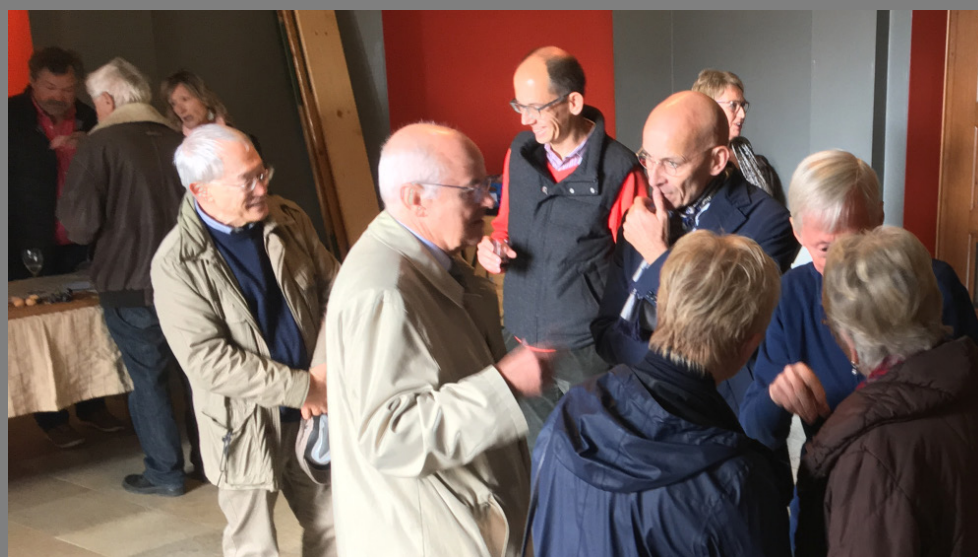
Degustation der Seduttore-Weine – angeregte Gespräche und Austausch im Quartier