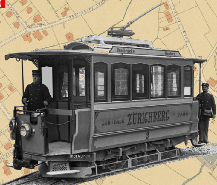
Wagen Nr. 2 der Zentralen Zürichbergbahn ZZB Typ Be 2/2 von 1895m der Maschinenfabrik Oerlikon MFO