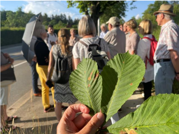
Die «Balkan-Miniermotte wütete zuerst beim Busbahnhof am Sihlquai