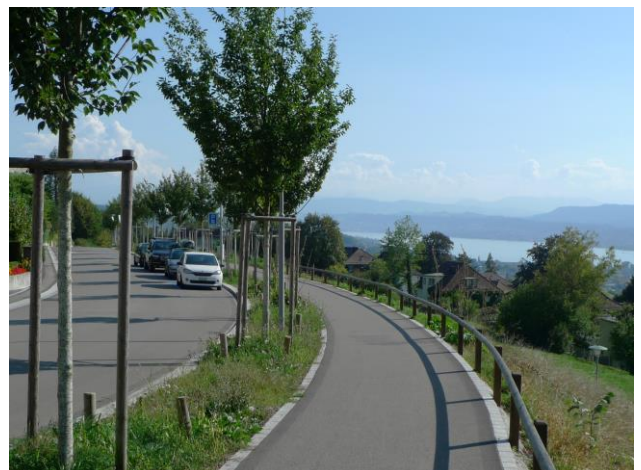
Freudenbergstrasse: wechselnde Baumarten, durchgängiger Grünstreifen