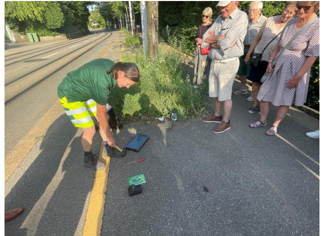
Ausrüstung für regelmässige Baumkontrolle: Hammer, Pilzbuch, iPad...