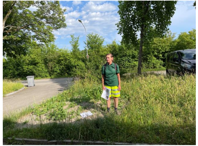
Flunterns schwerste Schneeschäden im Jan. 21 waren hinter dem Zoo