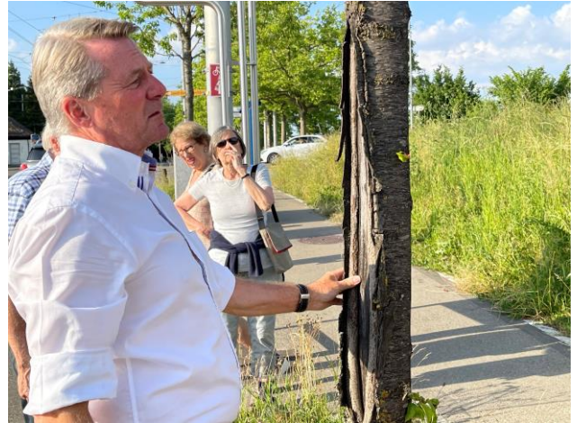
Ohne Schutzanstrich droht Schädigung durch das Aufplatzen der Rinde