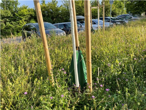
Für Neuanpflanzungen wichtig: Wassersack und weisser Schutzanstrich