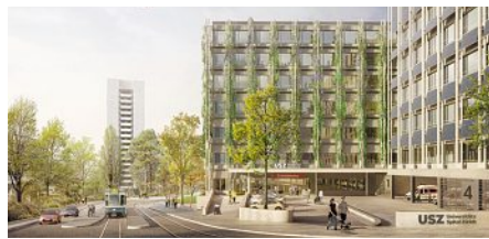
Visualisierung des Eingangs zum Notfallzentrum an der Gloriastrasse.

Visualisierung: © Atelier Brunecky und alsh