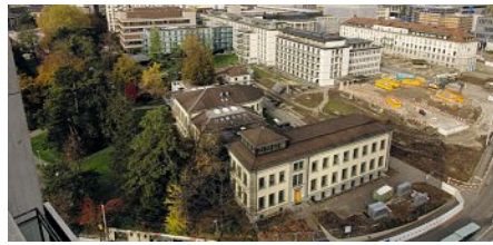
Aufnahme von einer der zwei Baustellen-Webcams auf www.usz.ch/campusmitte .

Für Mittwoch, den 7. Dezember laden wir Sie herzlich ein zu unserer nächsten Informationsveranstaltung, zu den Baumassnahmen im USZ-Areal: 18.30–20 Uhr im Hörsaal West beim Unispital-Haupteingang Rämistrasse 100. Der Quartierverein Fluntern und das Universitätsspital Zürich planen Fachreferate zu folgenden Themen: über den Stand des Spital-Neubauprojekts Campus MITTE1|2, über den Baustellenablauf und den Umgang mit Emissionen sowie über den Baustellenverkehr im Hochschulgebiet Zürich Zentrum. Im zweiten Teil des Abends wollen wir wiederum auf Ihre persönlichen Fragen eingehen und sie beantworten.