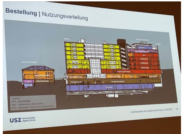
Die alte Anatomie links soll vermehrt der öffentlichen Zwecken dienen