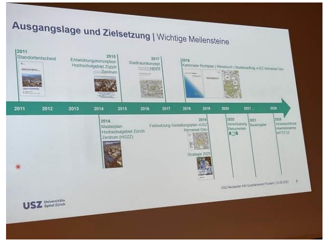
Der Standortentscheid im Rat fiel 2011, wird die Eröffnung 2028 sein?