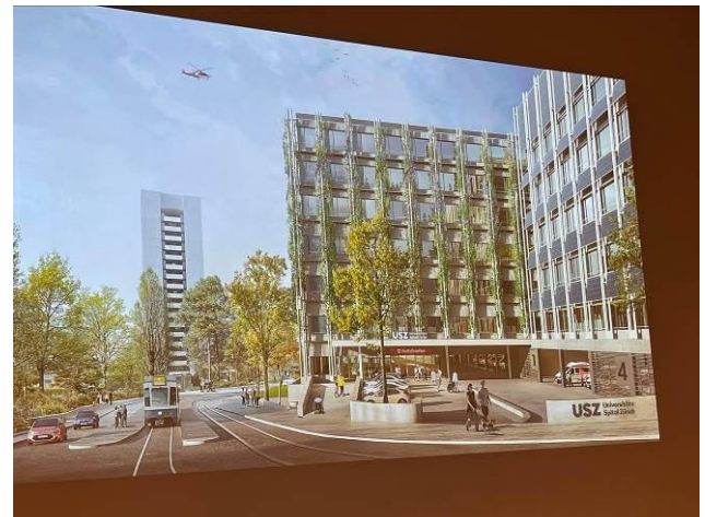
Die Tramhaltestelle Platte (oder Unispital?) wird nach oben verschoben