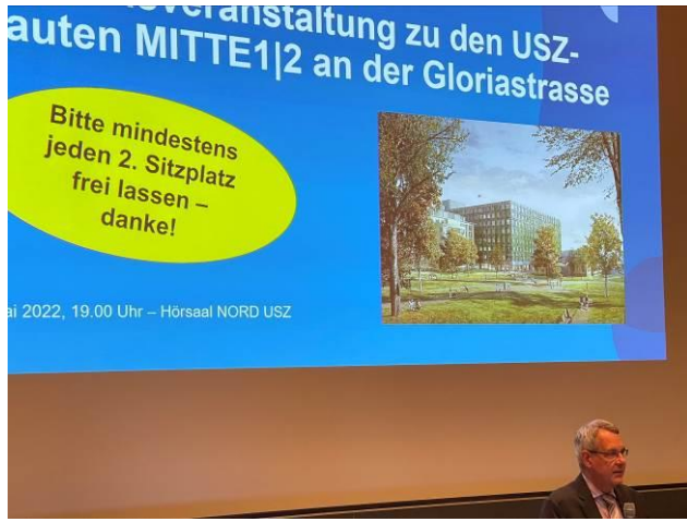
Der Hörsaal im USZ Nord1, angesichts Covid-Masken & -distanzen voll