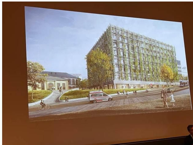
Blick vom Careum auf die alte Anatomie (links) und den Neubau Mitte