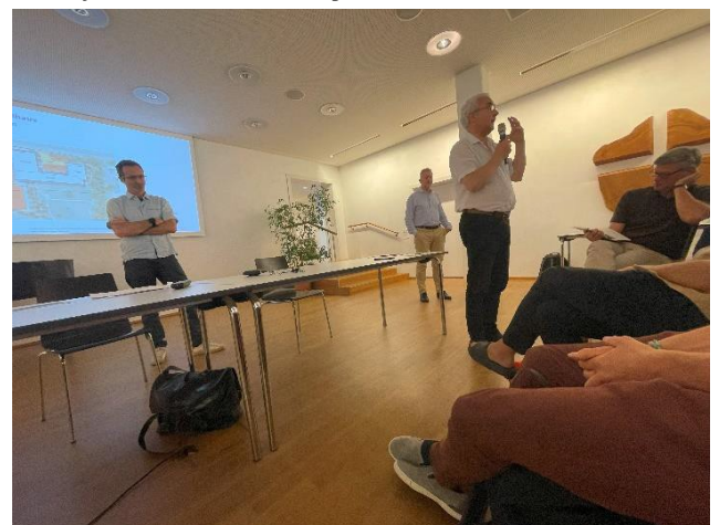
Das Projekt findet Wohlwollen, Vorbehalte werden kompetent ausgeräumt