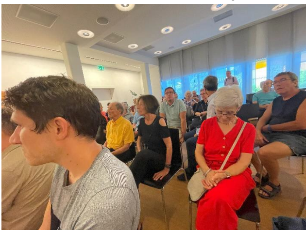
Angeregte Diskussion, etwas kritisch werden Zubringerfahrten beurteilt