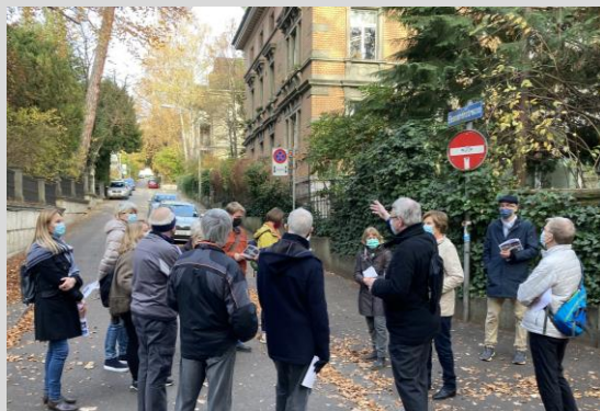
Abschluss Eleonorenstrasse, als «medizinischer Strassenname», Richtung Kinderspital

Gloriarank: einst Spitalfriedhof, heute Dermatologie, künftig Neubau Notfallstation (li); nach Abbruch der Uni-Pharmakologie freie Sicht auf die ETH-Elektrotechnik (re)