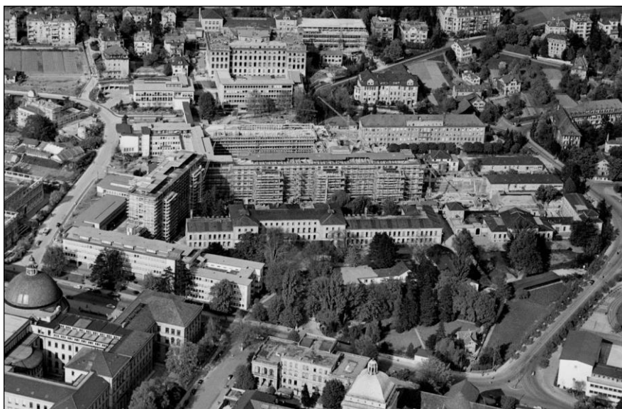
Luftaufnahme des alten Kantonsspital-Hauptgebäudes von 1840 (heute Spitalpark), umgeben von den neuen Bauten, um 1951.