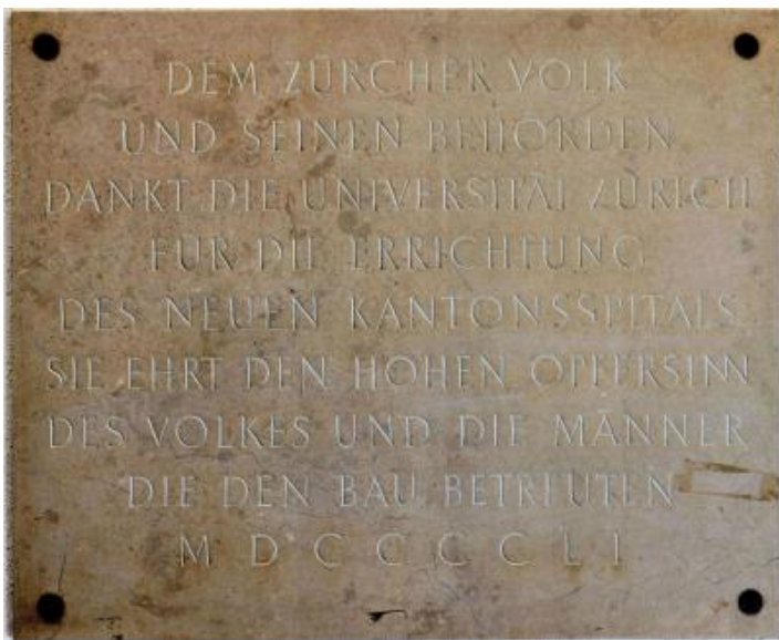
Rechts: Gedenktafel der Universität Zürich zur Eröffnung des Kantonsspitals 1951: «Dem Zürchervolk und seinen Behörden dankt die Universität Zürich für die Errichtung des neuen Kantonsspitals. Sie ehrt den hohen Opfersinn des Volkes und die Männer, die den Bau betreuten. MDCCCCLI».

Hinweis: Am Dienstag 15. Sept. 2026 12:15–12:48 Uhr erfahren die Interessierten im Rahmen der öffentlichen Vortragsreihe «33 Minuten Zürcher Medizingeschichte(n)» von L. Käser unter dem Titel «Kurz & bündig: die USZ-(hi)story – und wie unser heutiges Spital erbaut wurde. Anlässlich 75 Jahre Einweihung Kantonsspital Zürich 1951 und 475 Jahre Spitalneubau «Sammlig 1551» im USZ (Hörsaal folgt) in Bild und Wort die Entstehung die bauliche Entstehung unseres Unispitals, mit einem Rückblick auf die Anfänge des Zürcher Spitals vor 1186, auf den Neubau von 1840 und mit einem Ausblick auf den entstehenden Neubau an der Gloriastrasse.