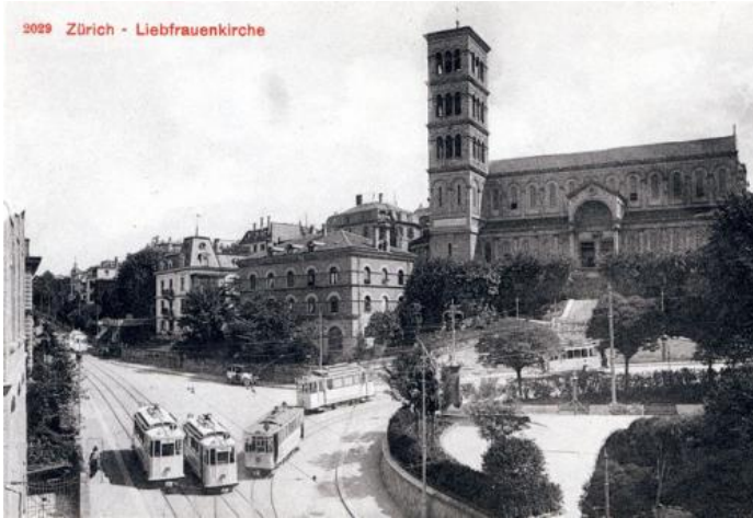
Dichter Tramverkehr zwischen Hochschulgebiet, Schaffhauserplatz und Central, am Haldenegg unterhalb der Liebfrauenkirche. Postkarte; © BAZ

Was die Zunft Fluntern am Sächsilüüte 1905 mit ihrer mitgeführten Tram-Maquette in origineller Form tatkräftig unterstützt hatte (>), nämlich die langersehnte direkte Tram-Verbindung des Quartiers Fluntern mit dem Hauptbahnhof Zürich, wurde am 9. Oktober 1906 Tatsache: die gelbe Linie 6, der sogenannte «Leonhardstram», führte nun vom Bahnhofplatz über die Brücke zum Central (damals Leonhardplatz), weiter zur Spitzkehre am Haldenegg unterhalb der Liebfrauenkirche, rumpelte dann die Leonhardstrasse zur Bergstation der 1889 eröffneten «Zürichbergbahn», dem heutigen Polybähnli, und fand via Tannenstrasse Anschluss ans Fluntermer Tram-Netz der «Zentralen Zürichbergbahn», den Zwilling der Zunft Fluntern: beide wurden 1895 gegründet.