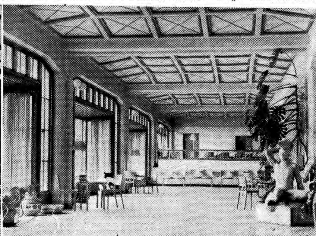
Besucherhalle beim Haupteingang