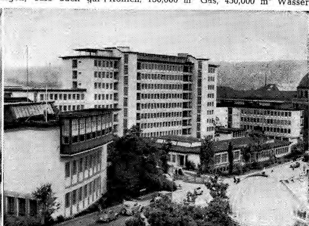
Bettenhaus West mit Vorfahrt für die Krankenwagen