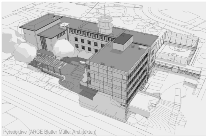
Perspektive (ARGE Blatter Müller Architekten)