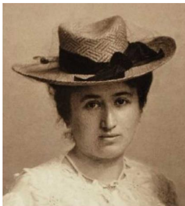
cand. iur.: die Marxistin Rosa Luxemburg in ihren Zürcher Studienjahren (Aufnahme um 1895–1900,)