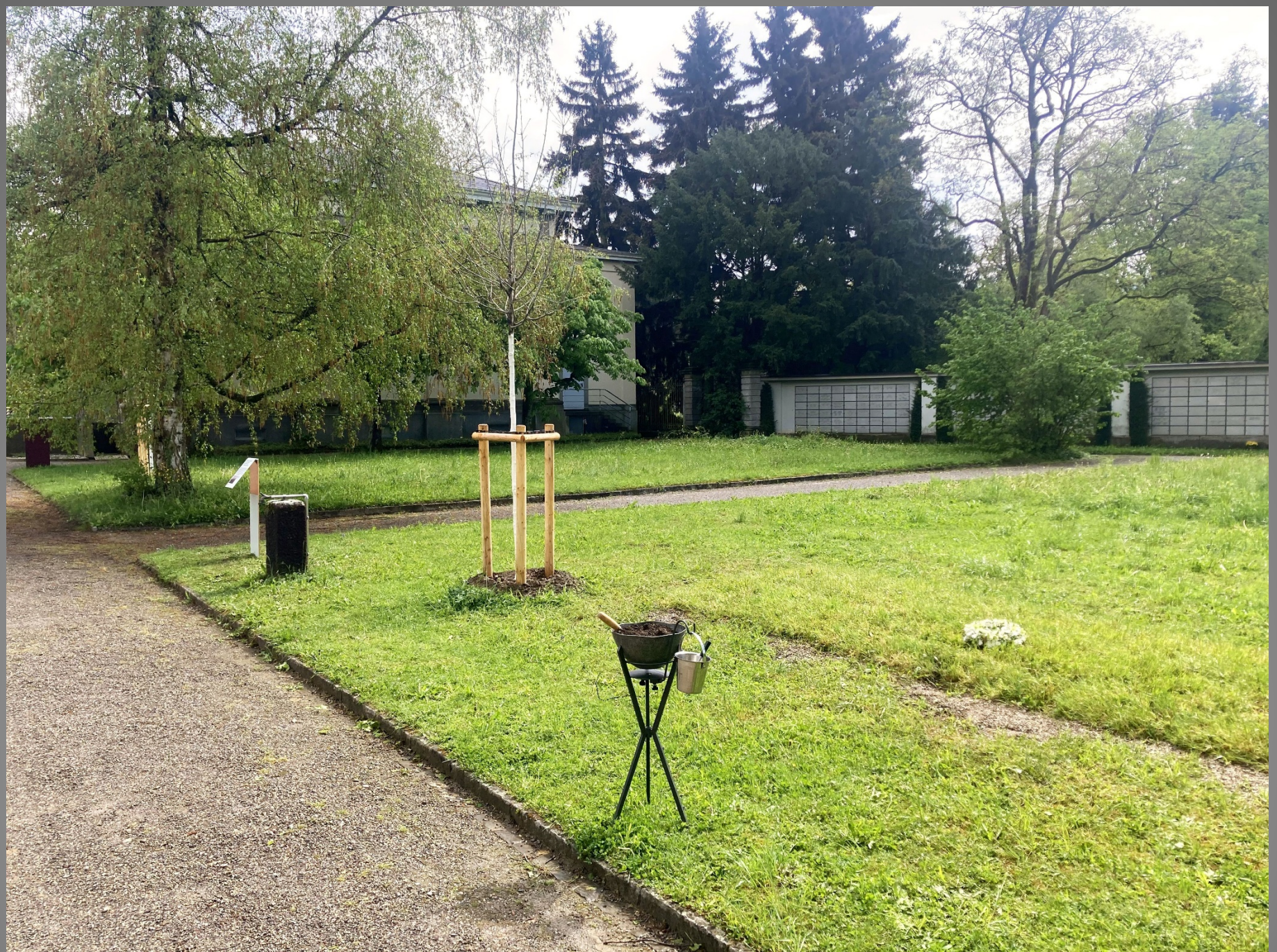
Das Gedenkfild – im Hintergrund die Friedhofskappelle A, das ehemalige erste Krematorium