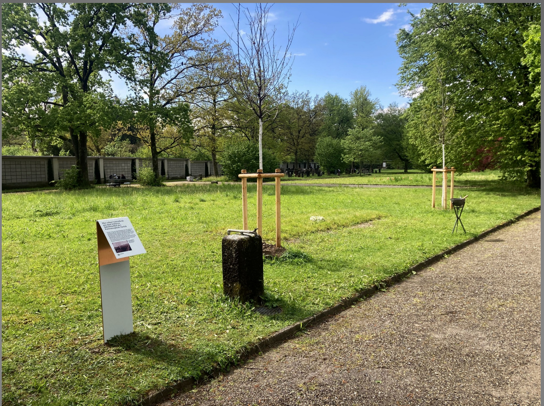
Das Grabfeld mit der Gedenktafel