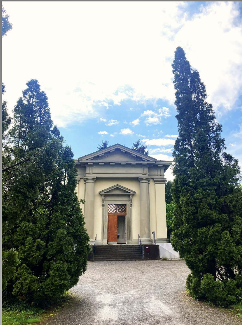
Der Gedenk Anlass an den Spitalfriedhof Gloriastrasse des Kantonsspitals auf dem Friedhof Sihlfeld: Friedhofskapelle A