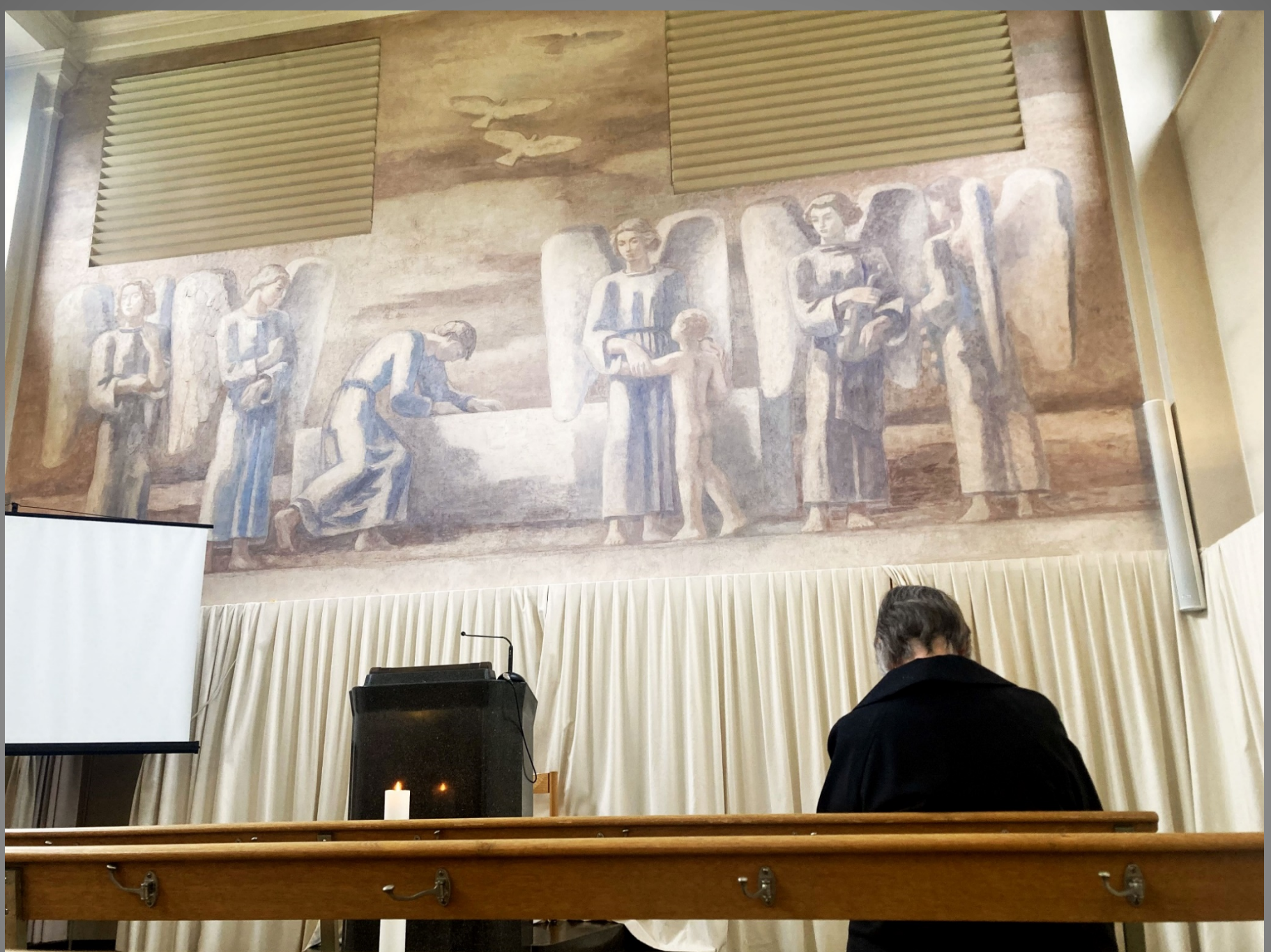
Orgelmusik von Alex Hug – Inneres der Friedhofkapelle A